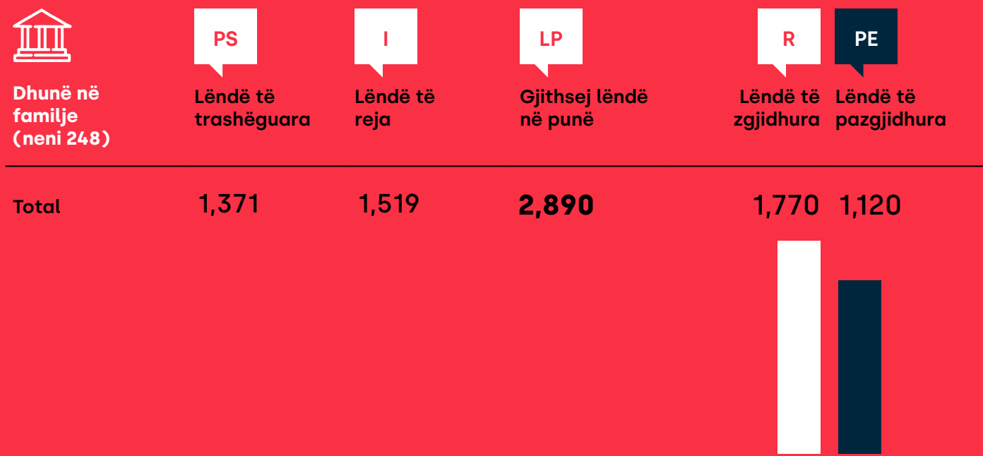
TABELA 1. Rastet e lëndëve të dhunës në familje në Prokurorin e Shtetit (1 janar - 30 qershor 2023).

Këto statistika janë bazuar në të dhënat zyrtare të pranuar nga Këshilli Prokurorial i Kosovës.